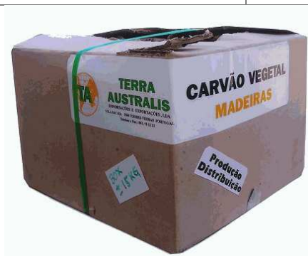
CAISSE CARTON > 10 Kg